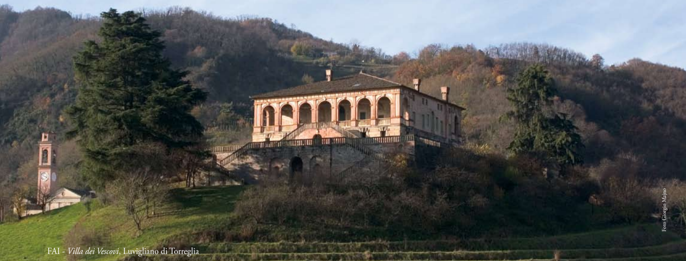
FAI - Villa dei Vescovi, Luvigliano di Torreglia